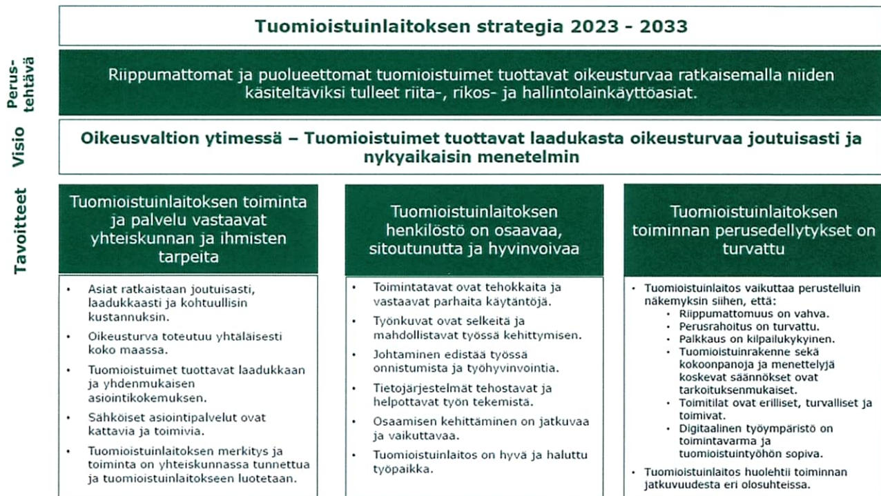
Kuva 1. Tuomioistuinlaitoksen strategia 2023–2033

Tuomioistuinlaitoksen toiminnan perusedellytykset tulee turvata kaikkina aikoina. Tuomioistuinlaitos pyrkii edistämään perusedellytysten turvaamista varautumisella ja aktiivisella vaikuttamistyöllä tavoitteiden saavuttamiseksi.